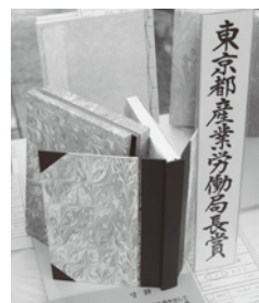
ハードカバー背継表紙 ポリシタルマフル(製本) (前回の訓練生最優秀作品)