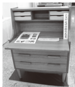
ライティングビューロー(木工) (前回の訓練生最優秀作品)

着物(振袖・創作帯等)、建築大工、製本(和綴り製本)、畳、板金(水差し等)、表具(屏風、掛け軸等)、美容(ヘアスタイル)、貴金属、印章彫刻(はんこ)、洋装(婦人服)、洋服(紳士服)、調理(季節の会席料理)、印刷(カレンダー)、和装、CAD(建築・3D)、電気工事、自動車整備、機械加工、サイン・ディスプレイ、木工、配管、広告美術、金型、アパレルパタンナー、ゲーム機、塗装、木製家具、溶接、メカトロニクス、製くつ、1/10サイズモデルカー、制御盤、精密加工、電気・通信工事、製パン、グラフィック他