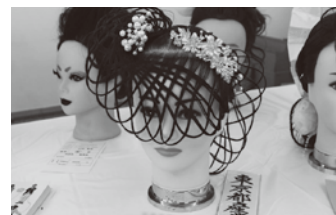
デザインアップスタイル(美容) (前回の訓練生最優秀作品)