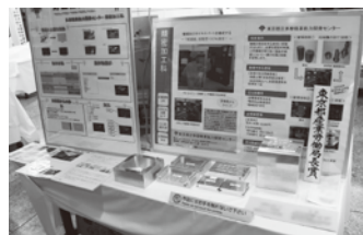
マシニングセンタ(機械加工) (前回の訓練生最優秀作品)

着物、建築大工、製本(和綴じ製本)、畳、板金(バケツ等)、表具(屏風、掛け軸等)、美容(ヘアスタイル)、貴金属、印章(はんこ)、洋裁(ドレス、婦人服)、洋服(紳士服)、調理(季節の会席料理と剥き物)、建具、印刷(カレンダー)、和装、自動車整備、サイン・ディスプレイ、機械加工、電気工事、プラスチック加工、CAD、金属加工、広告美術、板金溶接、塗装、木工、アパレルパタンナー、溶接、メカトロニクス、製くつ、モデルカー、組込みシステム、電気・通信工事、クリーンスタッフ、介護サービス、製パン他