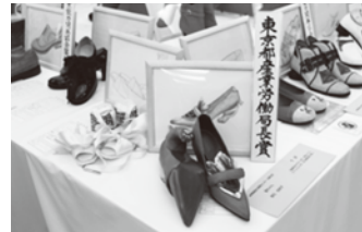
「猫ちゃん」 (前回の訓練生最優秀作品)

着物、建築大工、製本(和綴製本)、畳、板金(バケツ等)、表具(屏風、掛け軸等)、美容(ヘアスタイル)、貴金属、印章(はんこ)、洋裁(ドレス、婦人服)、洋服(紳士服)、調理(季節の会席料理と剥き物)、建具、印刷(カレンダー)、和装、自動車整備、サイン・ディスプレイ、機械加工、プラスチック加工、CAD、金属加工、広告美術、板金溶接、木工、アパレルパターン、溶接、メカトロニクス、製こつ、モデルカー、電気・通信工事、クリンスタッフ、介護サービス、製パン他