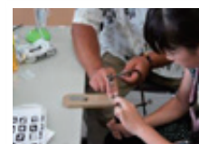
ものづくり体験教室