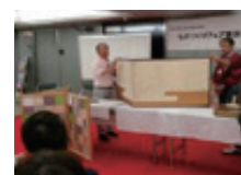
ものづくりフェア ステージ実演