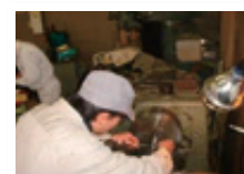
ものづくりマイスター派遣