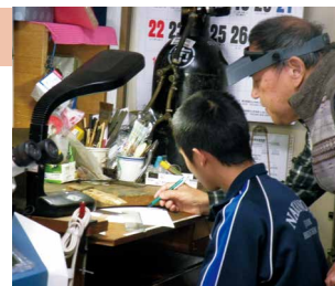
貴金属装身具店での体験風景