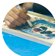
ステンシル塗装作品

内容 木工塗装に関する講義、塗装による額絵製作等 製作体験 技術科の授業として作成した木製CDラックの外観に種々の絵柄のシートを選んで、色の塗料を専用の筆でたくように塗ります(ステンシル塗装)。 ほとんど同じ外観の物が、各自の個性を持った作品になりました。