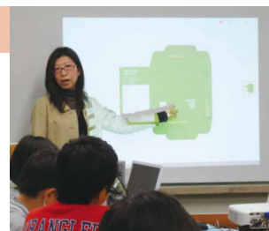
ITマスターによる実施風景