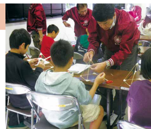
都立職業能力開発校にて、ものづくり体験 東京内装仕上技能士会