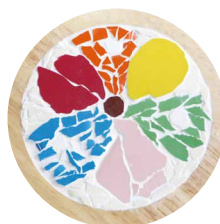
木製コースター作品例

内容 タイルの歴史や材料に関する講義、製作実演等 製作体験 木製コースターにタイル片を張付ける作業 下絵(事前作業)に合うよう色を選定したタイルを切断・研磨して、ボンドで貼り付けて、隙間にセメントを埋め込んで完成です。その後、汚れを拭取り、乾燥します。