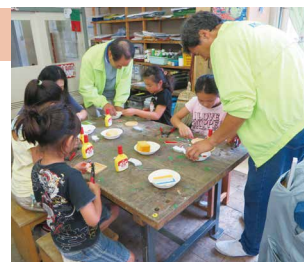
東京都タイル技能士会