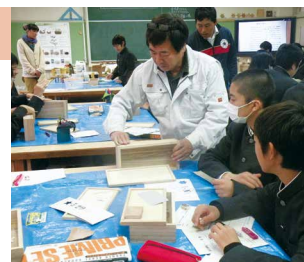
塗装のものづくりマスター