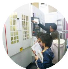
精密機械企業にて見学

内容 午前:ものづくりマスターによる講義及び製作体験 午後:事業所・工場見学(2班別行動)、借上げバスで移動 製作体験 竹ひごの棒の枠組みに和紙を刷毛で貼り付けしてミニランプシェードを作成しました。 事業所見学 都立職業能力開発校 工場見学 絞り加工企業、精密機械企業